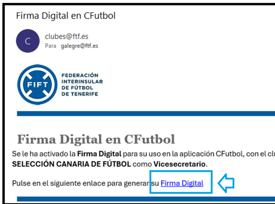
Imagen C12.24-25.01. Correo electrónico de generación de Firma Digital.

Una vez que la solicitud sea validada, el usuario recibirá un correo electrónico en el que le vendrá un enlace para que genere su Firma Digital como se muestra, a continuación, en la imagen: